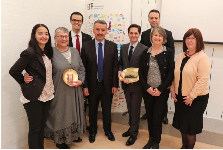
Avrupa Eğitim Kurumu (ETF), Torino