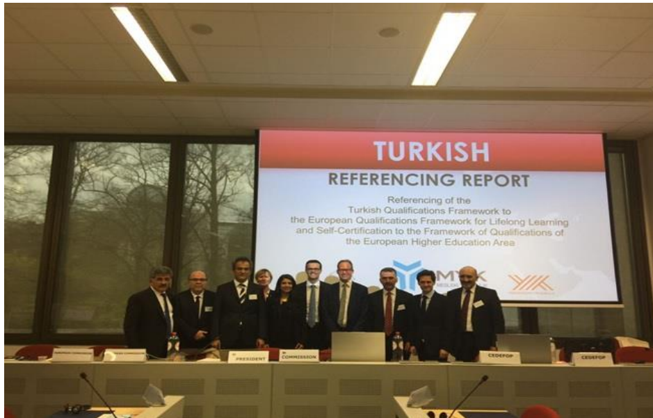
AYÇ Danışma Grubu 40. Toplantısı

TYÇ'nin AYÇ'ye referanslanması, son 15 yılda yürütülen çalışmalar sonucunda ülkemiz eğitim, öğretim ve yeterlilik sisteminin Avrupa normlarına ulaştığını göstermesi bakımından tarihi bir öneme sahiptir. 2014 yılında MYK tarafından başlatılan ve MEB, YÖK, bakanlıklar, kamu kurum ve kuruluşları, AB düzeyindeki ilgili kurumlar, sendikalar, meslek örgütleri, sivil toplum kuruluşları, öğrenci konseyleri, yerli ve yabancı bağımsız uzmanlar ve akademisyenlerle işbirliği içerisinde yürütülen referanslama süreci başarıyla tamamlanmıştır. Böylece, TYÇ'nin önemli hedeflerinden birisi olan ülkemizde belgelendirilen yeterliliklerin Avrupa Birliği ülkelerinde daha anlaşılır ve güvenilir olması için önemli bir adım atılmıştır.