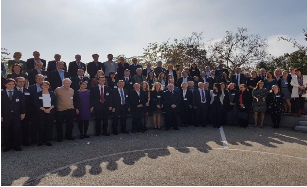
Akran Öğrenme Etkinliği, Yunanistan