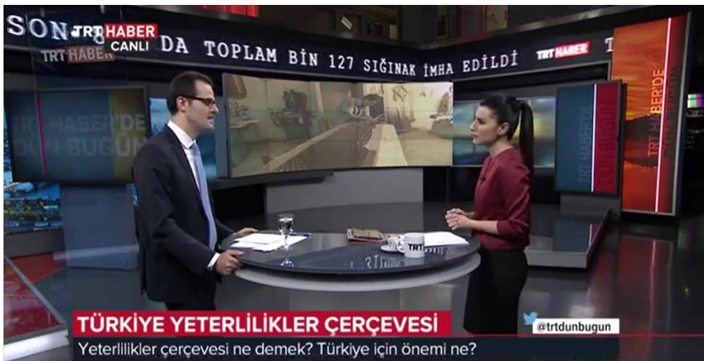
TRT Haber Dün Bugün Programı

2017 yılında ulusal ve uluslararası birçok etkinliğe katılım sağlanmış, paydaşlar tarafından düzenlenen etkinliklerde tanıtıcı sunumlar yapılmış, ulusal televizyon kanallarındaki programlarda TYÇ, AYÇ, referanslama ve önemi konularında kamuoyu bilgilendirilmiştir.